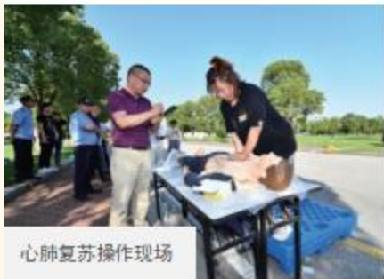
心肺复苏操作现场