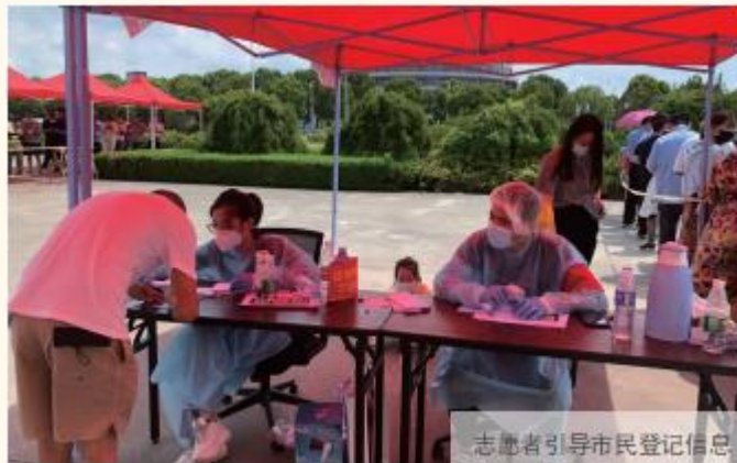
志愿者引导市民登记信息

2021 年年中，公司积极响应海安市新冠肺炎疫情防控工作指挥部的号召，投入到海安市全员核酸检测实战中，成为全市 259 个核酸检测采样点之一，附