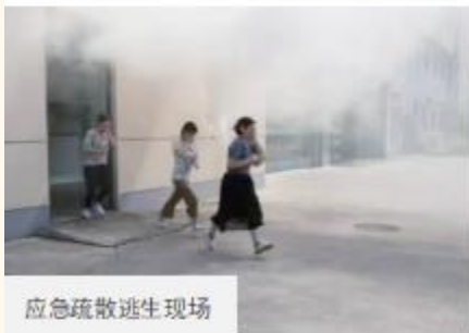
应急疏散逃生现场