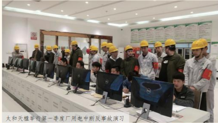
大和天楹举行第一季度厂用电中断反事故演习

急处置、快速反应、分级负责、协调一致的原则，坚持做到作业过程中一旦出现重大安全事故及重点安全风险，