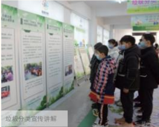
垃圾分类宣传讲解