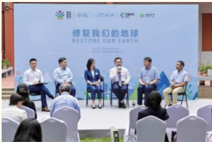
公司参加联合国环境规划署驻华代表处举办的世界环境日主题活动

公司的发展离不开健康和谐的社会环境，公司始终以回报社会为己任，积极投身社会公益事业，将关爱社会作为企业文化建设的一项重要组成部分，在公司快速发展的同时，始终坚持“为顾客创造价值，为股东创造财富，为员工创造利益，为社会创造繁荣”，将企业使命和社会责任相结合，身