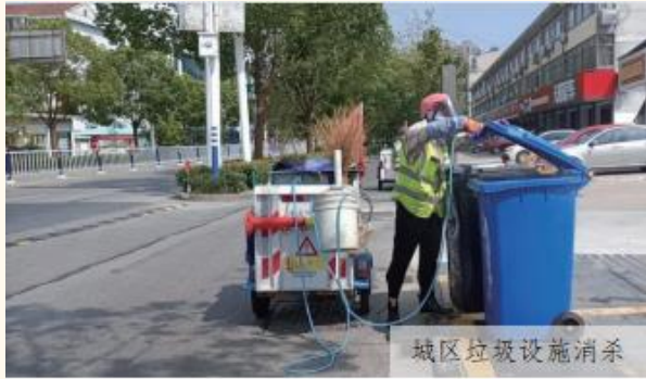
城区垃圾设施消杀

2021 年，新冠疫情在各地零星爆发，为进一步加强新冠肺炎疫情防控工作，有效从源头上控制病菌滋生，坚决遏制疫情扩散，公司各环卫项目子公司全面贯彻落实各地的环卫防疫要求，坚守岗位，奋战在抗击疫情的第一线。环卫工人们