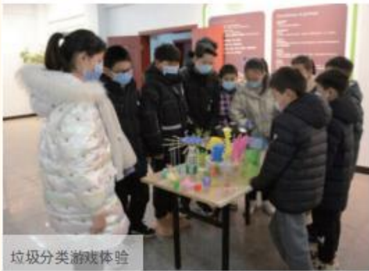
垃圾分类游戏体验

作为专注于环境保护的上市公司，公司的环境服务水平和质量影响千家万户，其中与社区的沟通和交流也尤其重要。公司每年发布社会责任报告，披露企业社会责任建设年度状态，使公众了解上一年度公司对社会责任的承担情况；定期开展世界环境日等环保主题开放日活动，邀请社会各界人士参观交流、邀请厂区周边居民实地走访生产一线、联系学校组织中小學生进行环