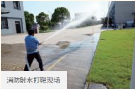
消防射水打靶现场

能够迅速、快捷、有效的启动应急救援系统。公司通过强化日常安全监督检查及现场管理，落实各级安全责任，查堵各种事故隐患，降低事故的后果，减少人员伤亡、财产损失和环境破坏。