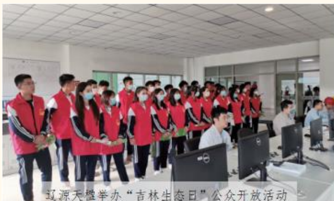
辽源天楹举办“吉林生态日”公众开放活动

针对垃圾焚烧发电项目和医废处置项目，公司坚持科学、规范地运营，建立、健全各项环保规章制度，并严格按照国家有关标准、环